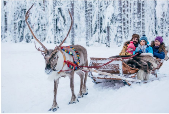
馴鹿場：馴鹿場一嚐雪鹿拉車滋味。

羅凡尼米 ~ 馴鹿場 ~ 雪鹿拉車 ~ 聖誕老人村 Rovaniemi ~ Reindeer Farm ~ Reindeer Ride ~ Santa Claus Village