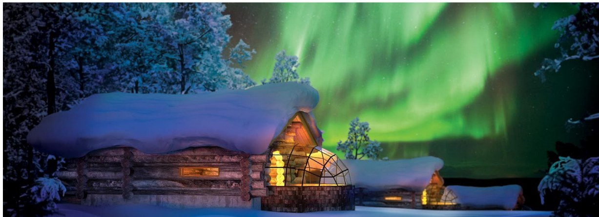
卡克斯勞特恩度假村 Kakslauttanen Arctic Resort (特色玻璃獨立木屋)