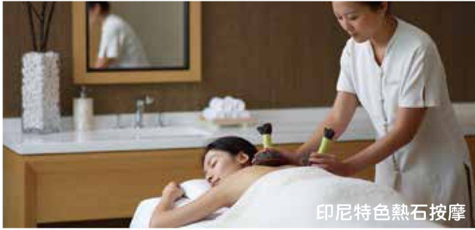
印尼特色熱石按摩

(可代安排團友自費參加QUICK SILVER海上遊或自費享受印尼特色熱石按摩)