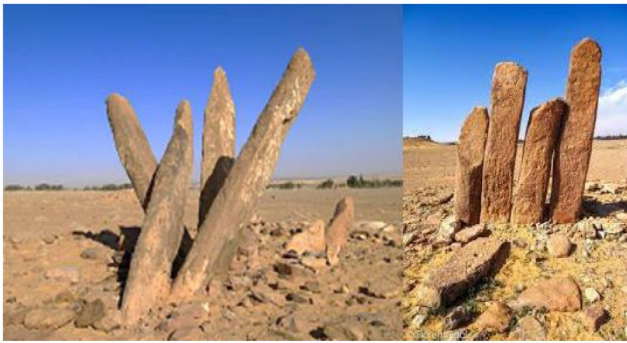
拉嘉基勒 Al-Rajajeel ：塞卡凱西南12公里處的一個遺址。它包含了約50個聳立的石柱群，這些遺址可追溯到公元前四千年。