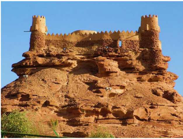
紮巴爾城堡 Qasr Zabal ：位於朱夫最大的市鎮-塞卡凱的高山上，它在1845年被一個叫喬治·瓦林（George A. Wallin）的旅行家首次提到。有證據表明它最初興建是在前伊斯蘭時期。