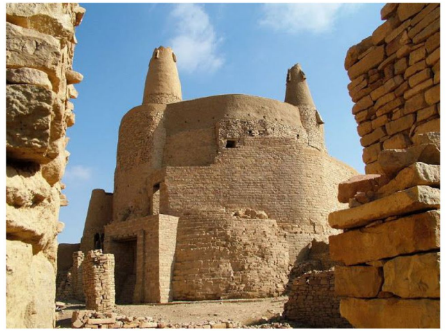
馬堡 ：4000年前的馬利堡是一座有城牆的堡壘，在那可以俯瞰整個古城。