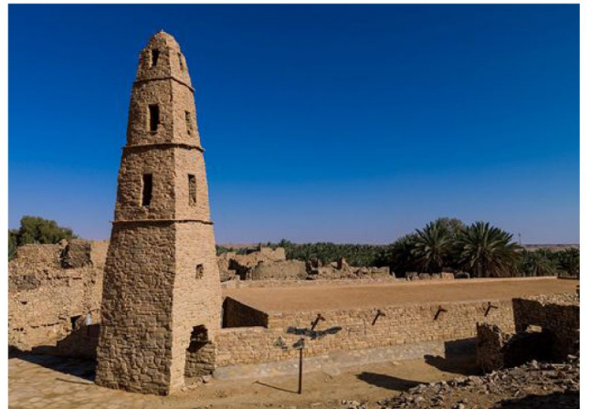
奧馬爾清真寺 ：建於7世紀，位於利馬堡的旁邊，是在第二任哈裏發歐麥爾·本哈塔布（Umar Bin Al Khatab)時期建立的，它是沙特阿拉伯北部最古老的清真寺。

早餐：酒店 午餐：當地餐館 晚餐：當地餐館 住宿：Holiday Inn 或 同級