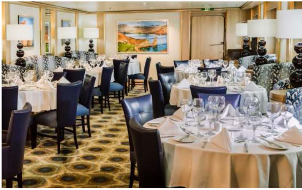
Darwin's Dining Room