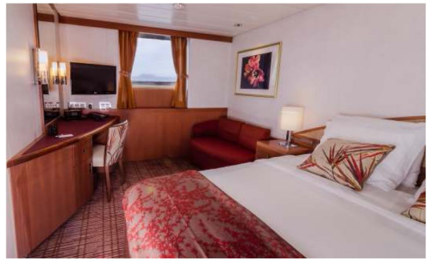
Premium & Deluxe Ocean View