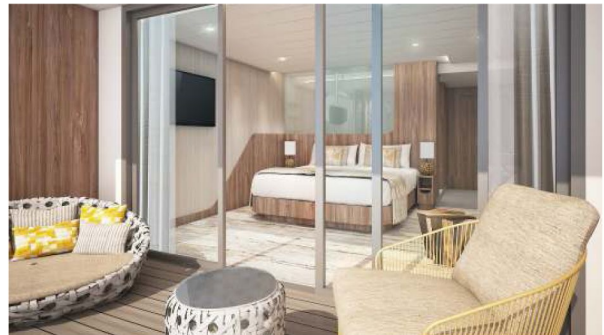
Sky Suite with Veranda