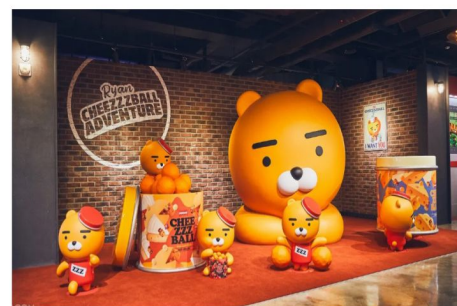
KAKAO FRIENDS 主題樂園