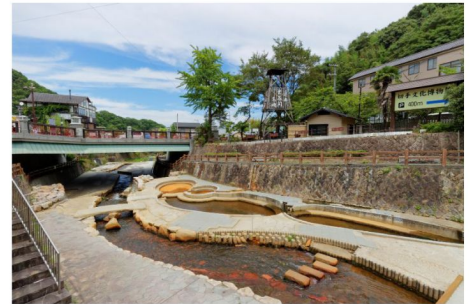
日本名泉：有馬溫泉街

錦市場全長390公尺，歷史可追溯至延曆年間（西元782年至805年），至1615年正式以「批發魚市場」之姿問世。如今錦市場對外開放讓一般民眾採購，來到這裡可以買到每日直送的海鮮、肉品、京都蔬果等許多在地特有食材，可說是與京都人的食生活有著密不可分的關係，也使得這座「京都的廚房」對於遠道而來的觀光客而言擁有無窮的魅力！