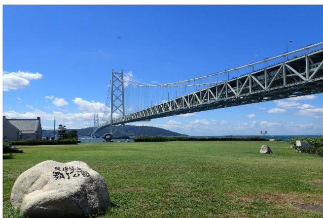
舞子公園（觀賞世界第一吊橋～明石海峽大橋）