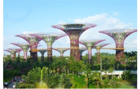
獅城新地標~濱海灣花園

早於19世紀牛車水已是華人聚居的地區，「牛車水」這個特別的名字據說源於該區早年居民以牛車載水。1822 年當新加坡進行首個城市規劃時，便正式將牛車水定為華人移民的居住區。雖然是華人聚居地，但附近一帶的，卻有不少殖民地風格的西式建築，可謂華洋薈萃，別樹一格。