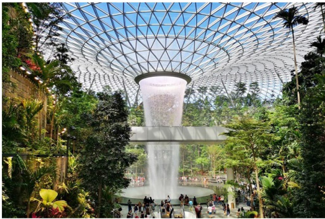
嶄新地標~星耀樟宜雨漩渦瀑布

保證乘搭《國泰》豪華客機，直航往返 獅城印記濱海灣花園、『獅頭魚尾像』、牛車水唐人街 新加坡嶄新地標~星耀樟宜：世界最高室內兩漩渦瀑布、資生堂森林谷