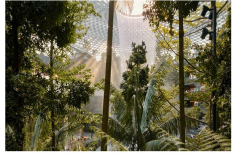
星耀樟宜森林谷一景

在這座都市綠洲，可欣賞到 40米高的“雨漩渦”——這是世界最大型的室內瀑布——也可以在種植了 2000 棵樹木的“森林谷”中，探索繁茂的自然風光。