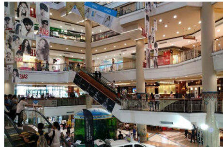
CENTRAL PLAZA CHIANG MAI AIRPORT