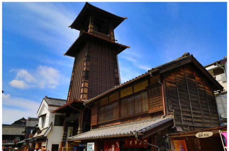
小江戸川越【時代之鐘】(川越的地標)