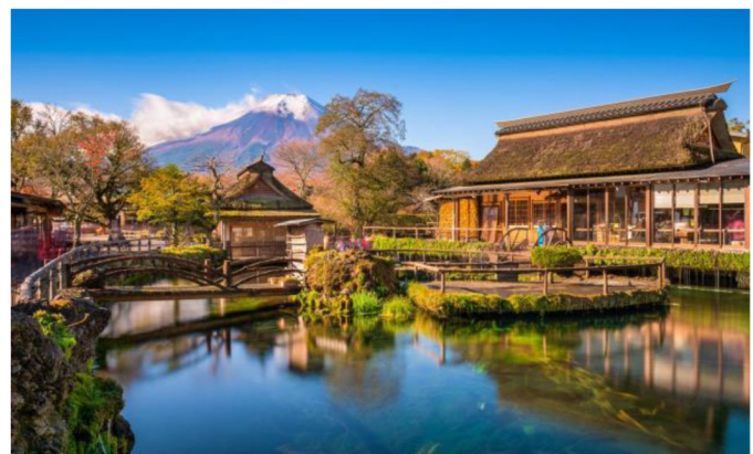
富士【忍野八海】新富岳百景之一