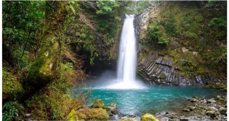
日本瀑布100選【淨蓮瀑布】