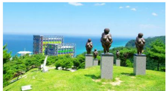
Haslla藝術博物館+雕刻公園