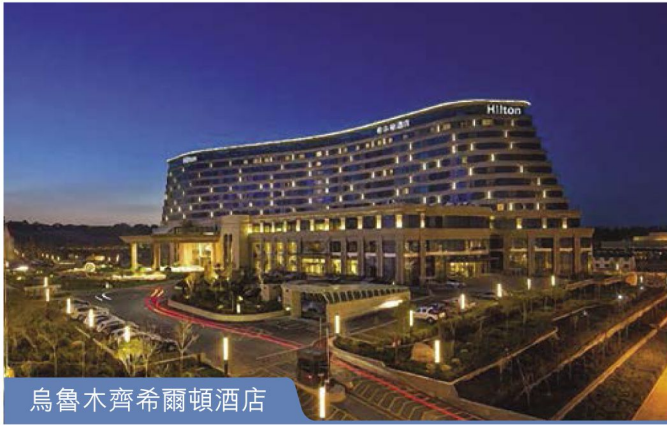
烏魯木齊希爾頓酒店