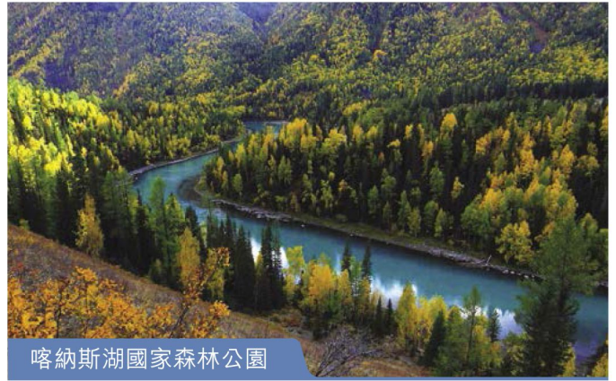
喀納斯湖國家森林公園