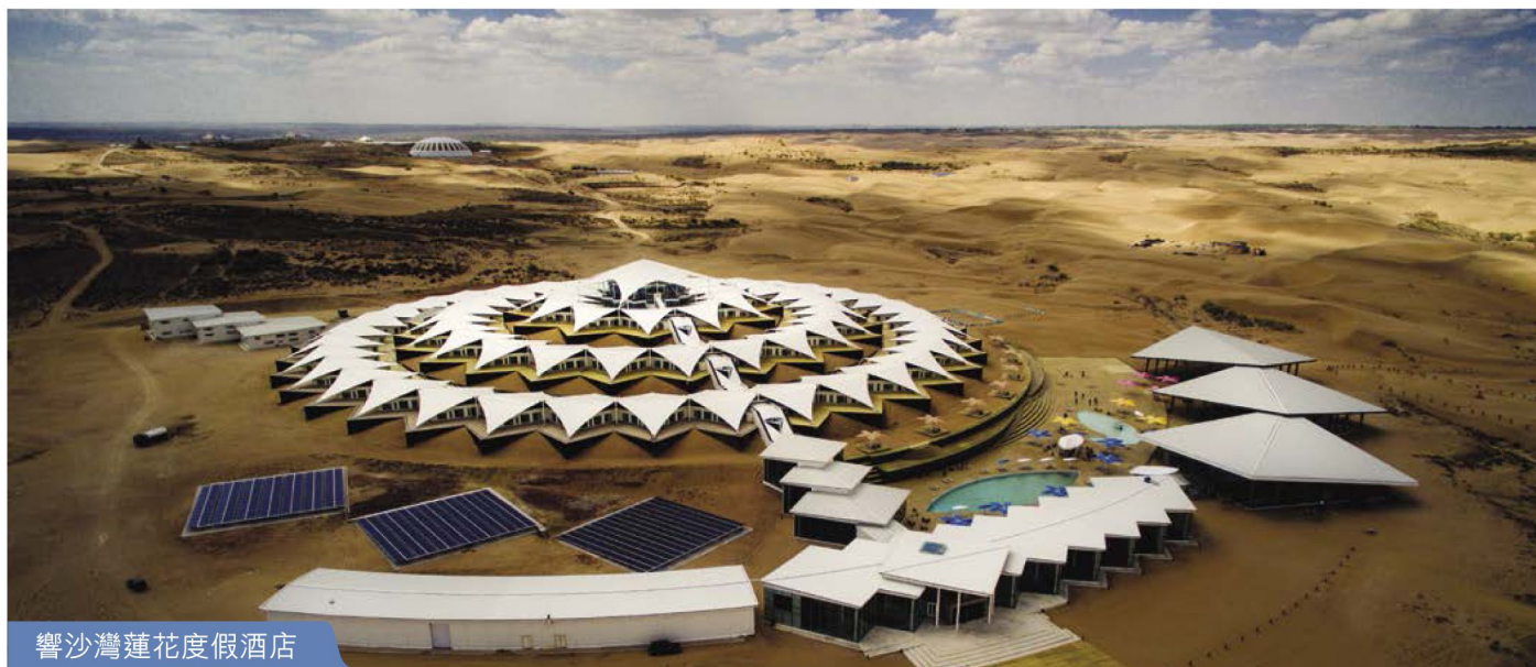
響沙灣蓮花度假酒店