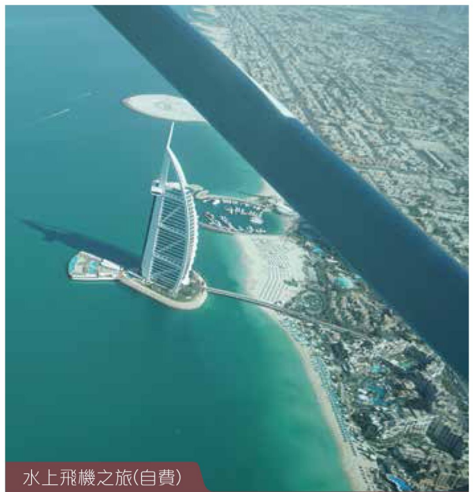
水上飛機之旅(自費)