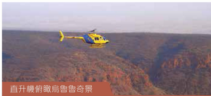
直升機俯瞰烏魯魯奇景