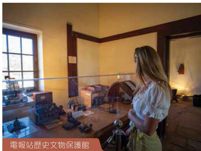
電報站歷史文物保護館