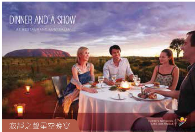
寂靜之聲星空晚宴