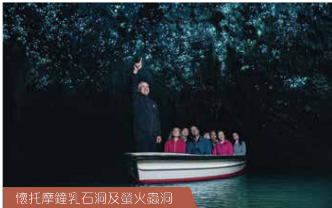
懷托摩鐘乳石洞及螢火蟲洞