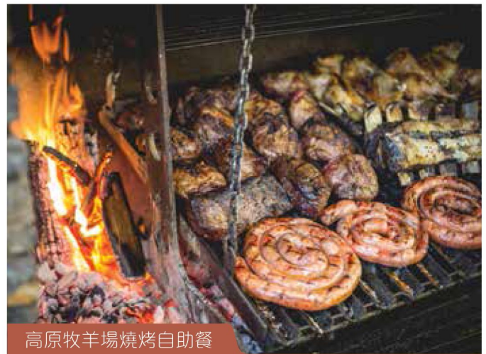
高原牧羊場燒烤自助餐