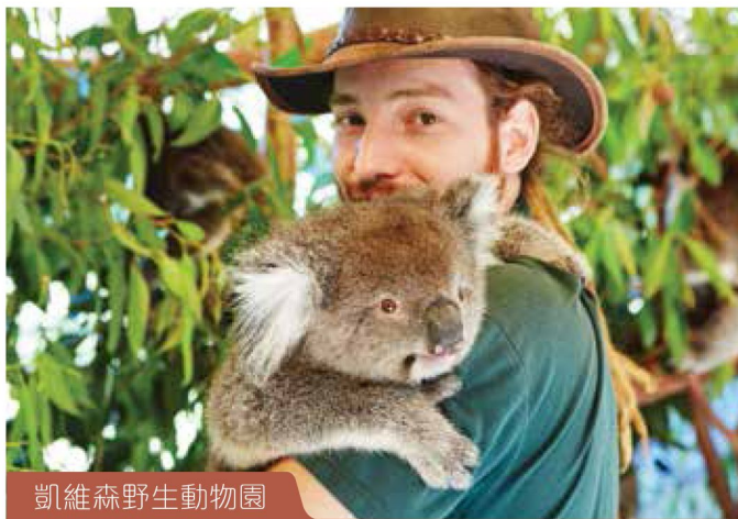
凱維森野生動物園