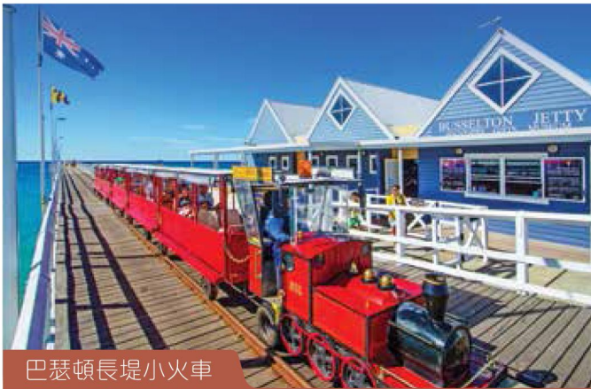
巴瑟頓長堤小火車