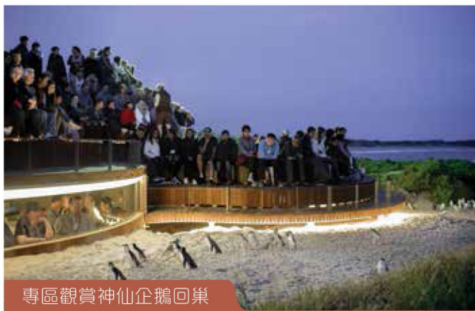
專區觀賞神仙企鵝回巢