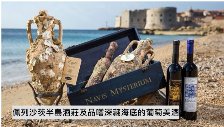
佩列沙茨半島酒莊及品嚐深藏海底的葡萄美酒