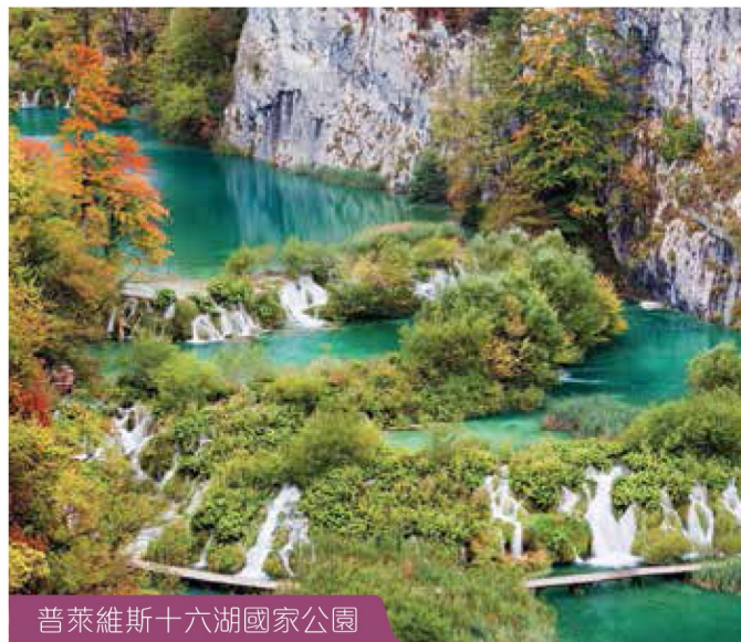
普萊維斯十六湖國家公園