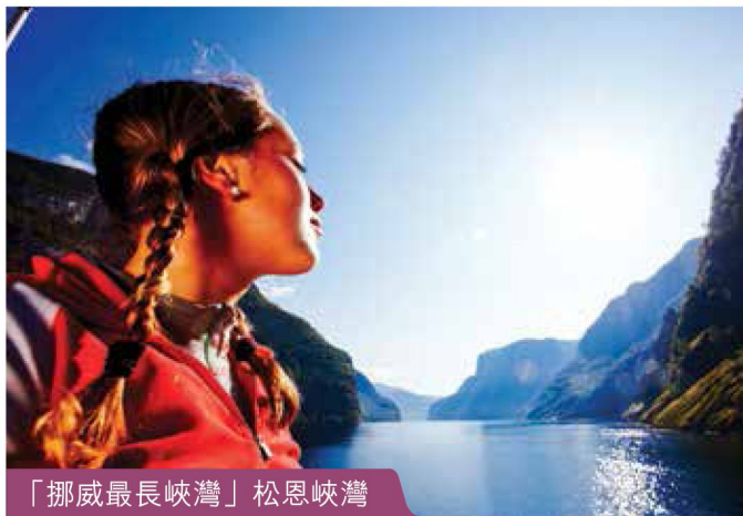
「挪威最長峽灣」松恩峽灣