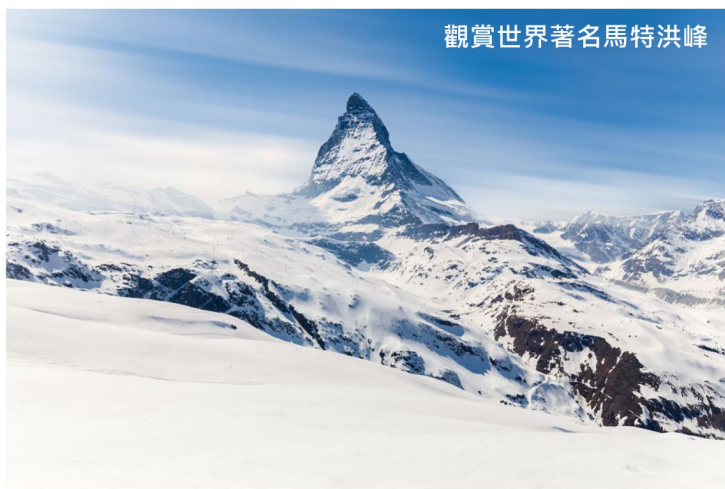
觀賞世界著名馬特洪峰