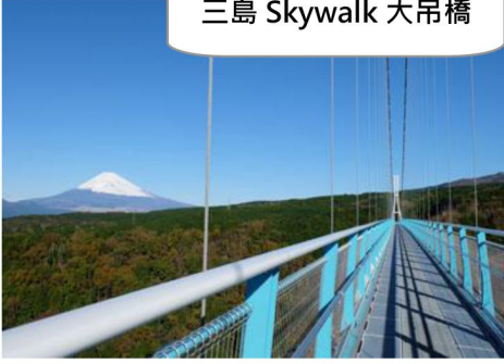
三島 Skywalk 大吊橋