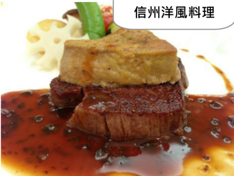
長野必嚐名物- 信州洋風料理