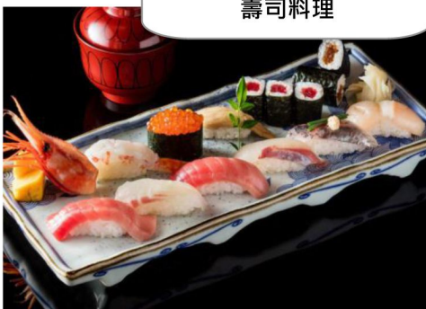
採用伊豆最新鮮魚介- 壽司料理