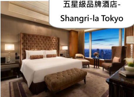
五星級品牌酒店- Shangri-la Tokyo