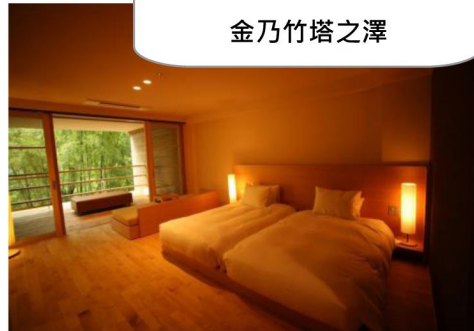
房間設有私人露天風呂- 金乃竹塔之澤