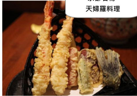
京都名物- 天婦羅料理