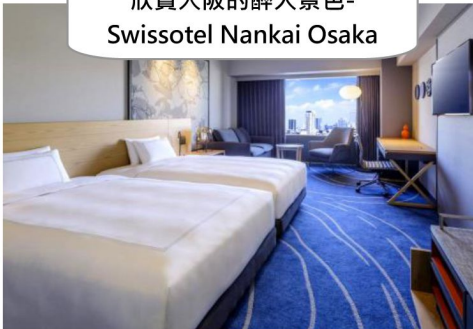
欣賞大阪的醉人景色- Swissotel Nankai Osaka