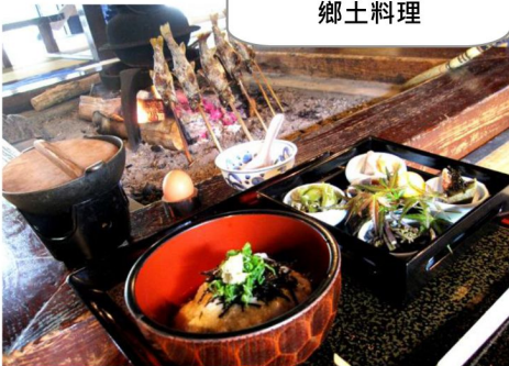
傳統的圍爐裏文化 鄉土料理