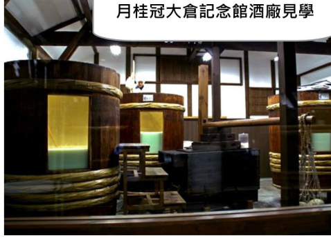
月桂冠大倉記念館酒廠見學