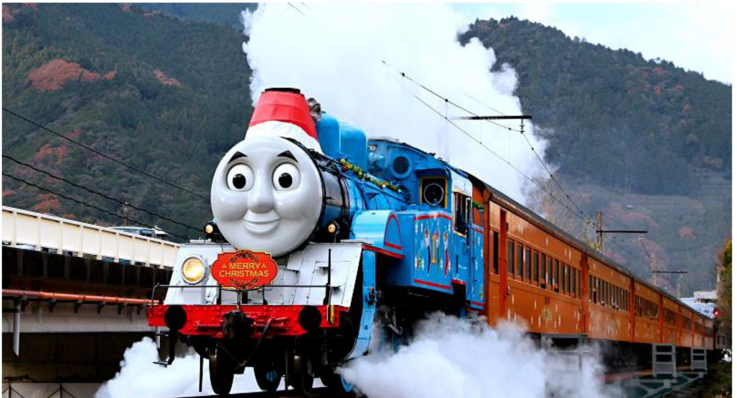
所有圖片只供參考