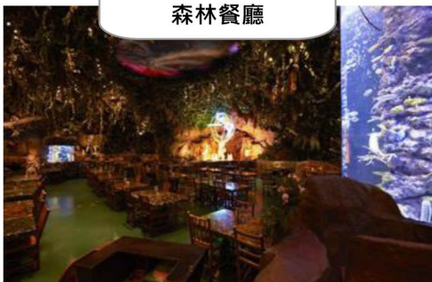
欣賞巨大水槽- 森林餐廳