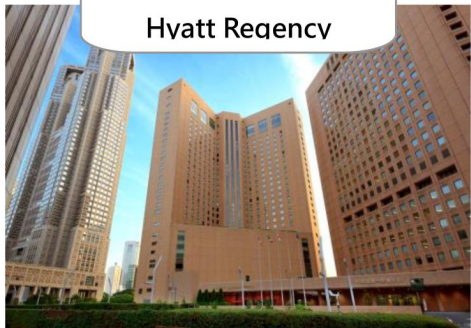
鄰近購物區- Hvatt Regency