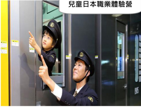
兒童日本職業體驗營