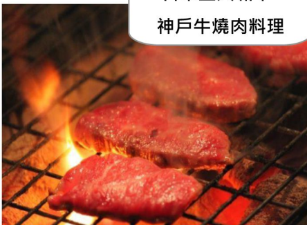
日本三大和牛- 神戶牛燒肉料理