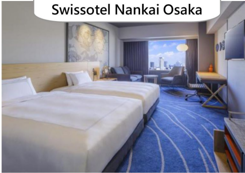
鄰近購物區- Swissotel Nankai Osaka