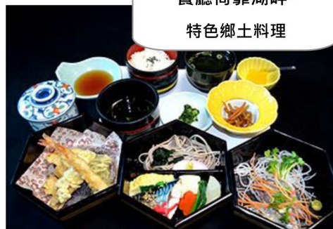
餐廳倚靠湖畔- 特色鄉土料理