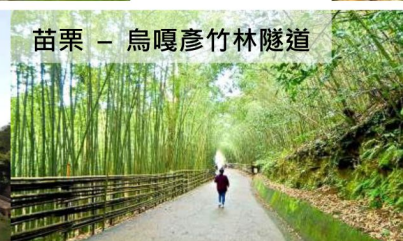
苗栗 - 烏嘎彥竹林隧道