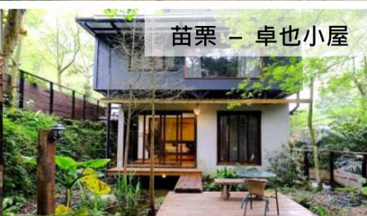
苗栗 - 卓也小屋