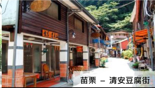
苗栗 - 清安豆腐街