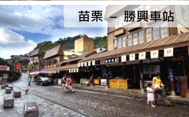
苗栗 - 勝興車站