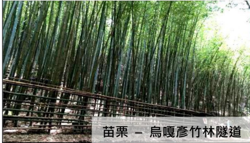
苗栗 - 烏嘎彥竹林隧道