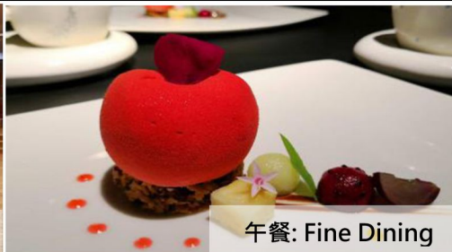
午餐: Fine Dining