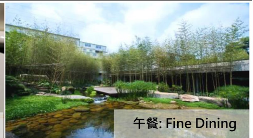
午餐: Fine Dining