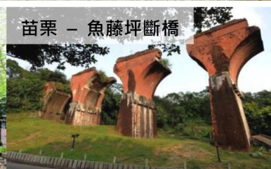
苗栗 - 魚藤坪斷橋