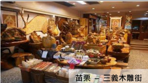
苗栗 - 三義木雕街