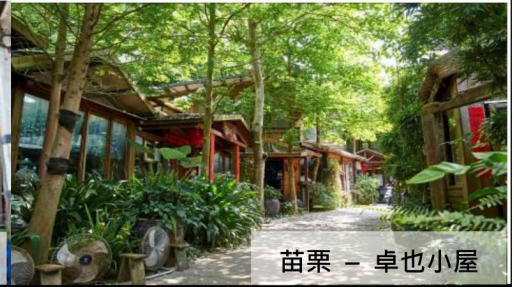
苗栗 - 卓也小屋