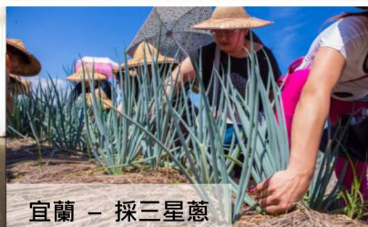
宜蘭 - 採三星蔥