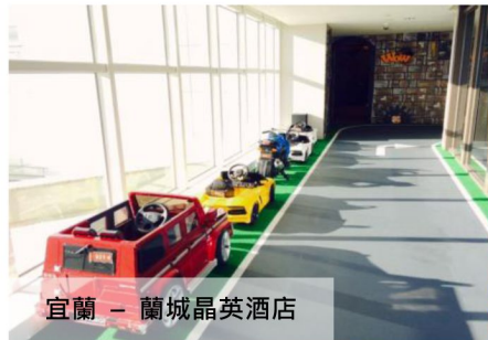
宜蘭 - 蘭城晶英酒店