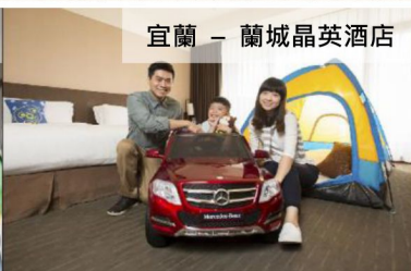
宜蘭 - 蘭城晶英酒店