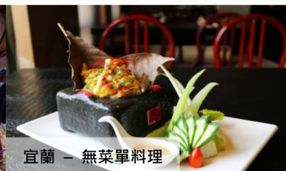
宜蘭 - 無菜單料理