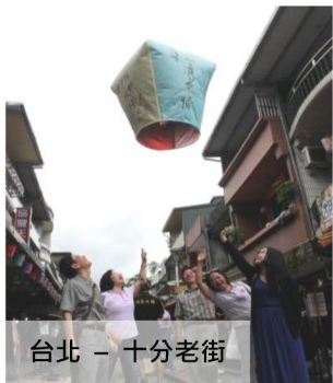
台北 - 十分老街