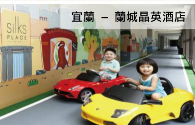
宜蘭 - 蘭城晶英酒店