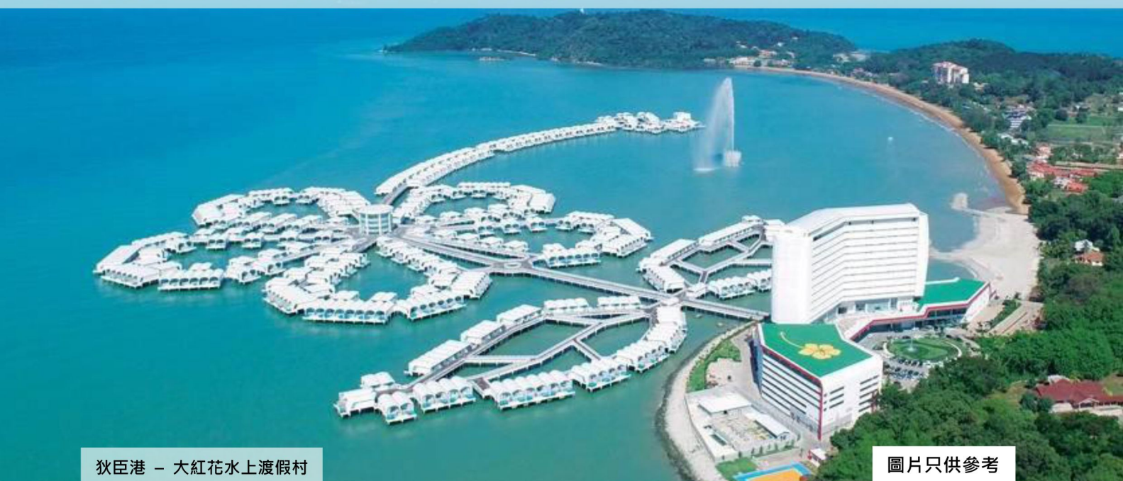
狄臣港 - 大紅花水上渡假村