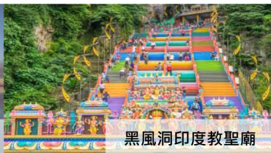
黑風洞印度教聖廟