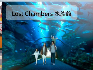
Lost Chambers 水族館