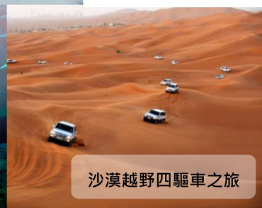
沙漠越野四驅車之旅