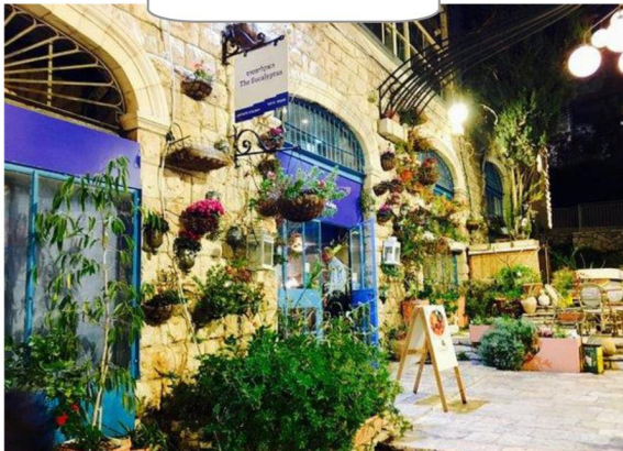
以色列 Fusion 菜