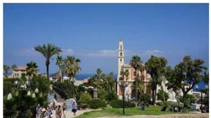
約帕·位處特拉維夫旁·是超過3500年的古代港口城市·瀟灑老街古城情懷。