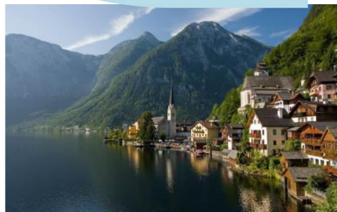
世界文化遺產 Hallstatt 哈修塔特 世上最美麗的湖畔小鎮