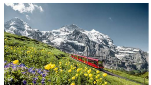
乘百年鐵道登歐洲之巔少女峰 遠眺阿爾卑斯山脈全景