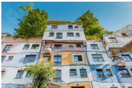
Hundertwasserhaus 漢德瓦薩之家： 一座人類和自然共生的公共住宅