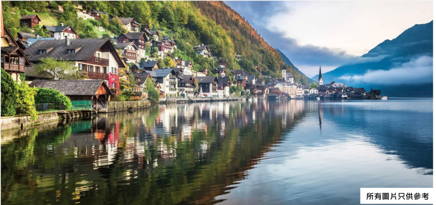
所有圖片只供參考