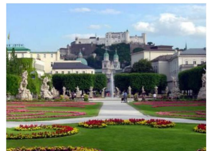
仙樂飄飄處處聞拍攝地： 米拉貝爾花園