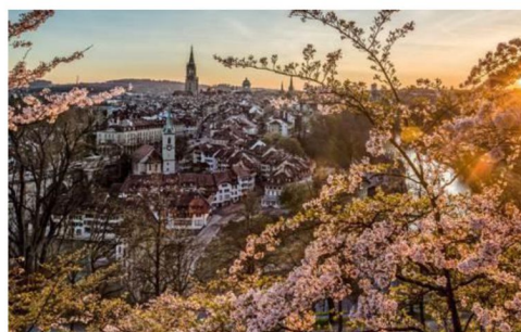
伯恩的玫瑰園是俯瞰是 伯恩全景的最佳位置