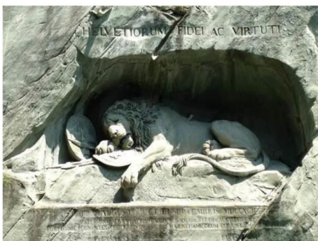
琉森垂死獅子像紀念 1792 年 8 月 10 日 保衛巴黎杜樂麗宮的 1100 名瑞士僱傭兵