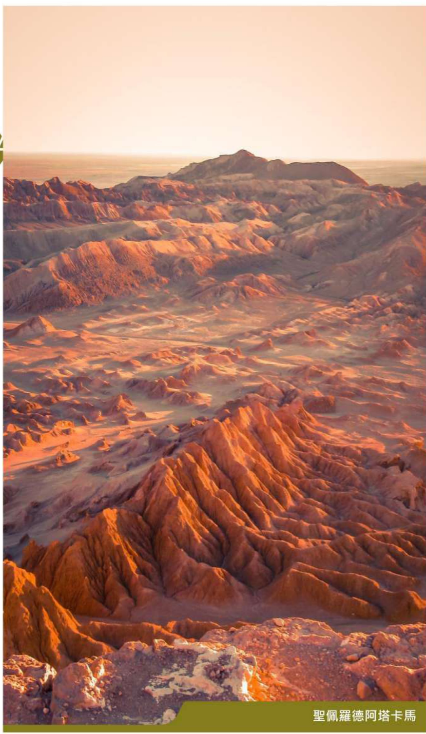
聖佩羅德阿塔卡馬