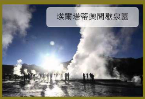
埃爾塔蒂奧間歇泉園