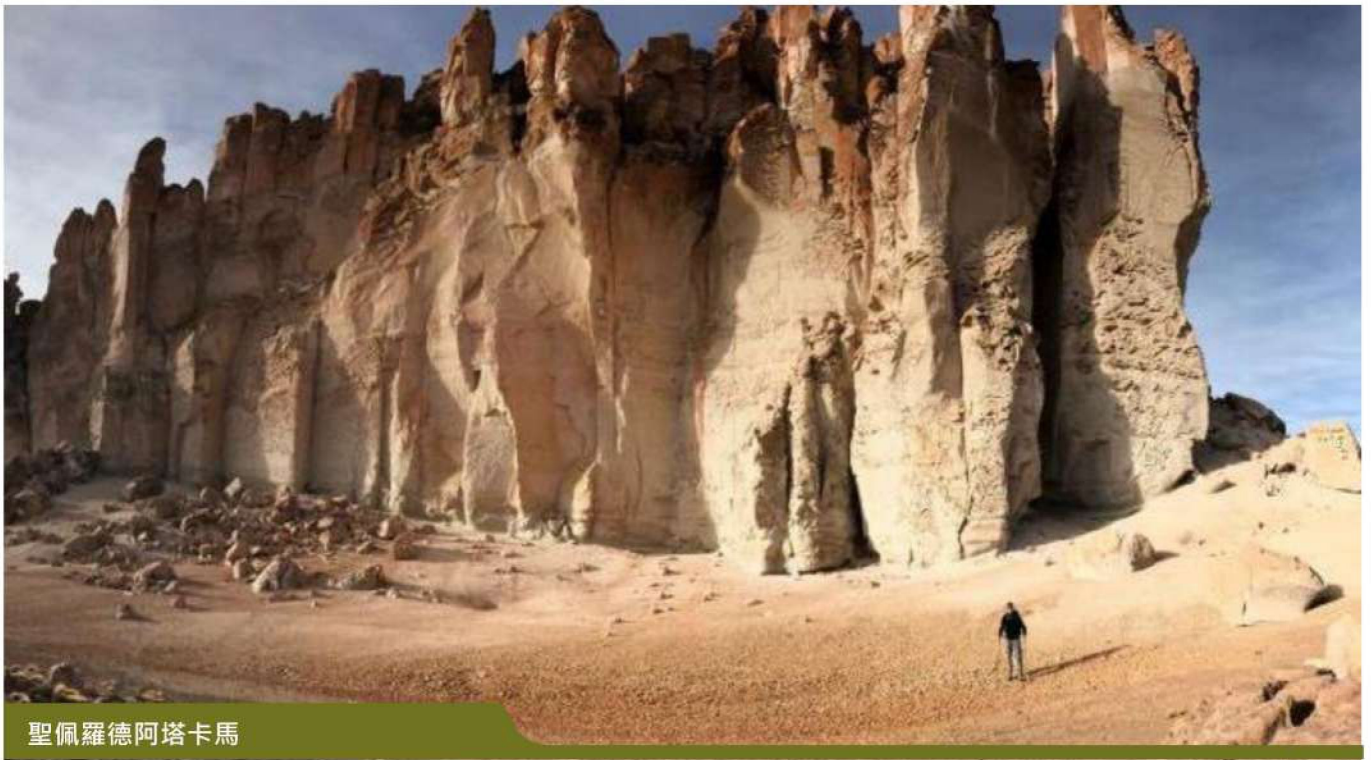
聖佩羅德阿塔卡馬