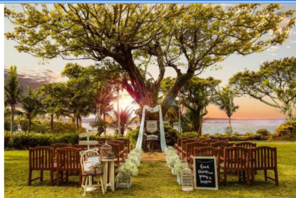
MOON BEACH GARDEN